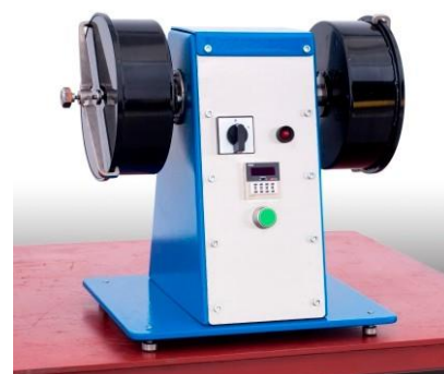
Mlýnek Rogi/Rogi mill