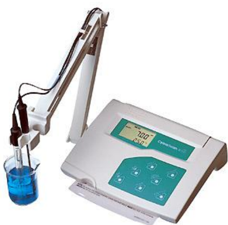
CyberScan pH 510