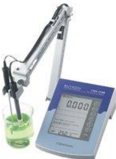
CyberScan pH 1500