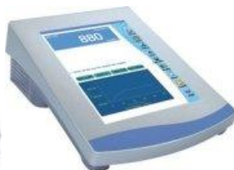
CyberScan pH 6500